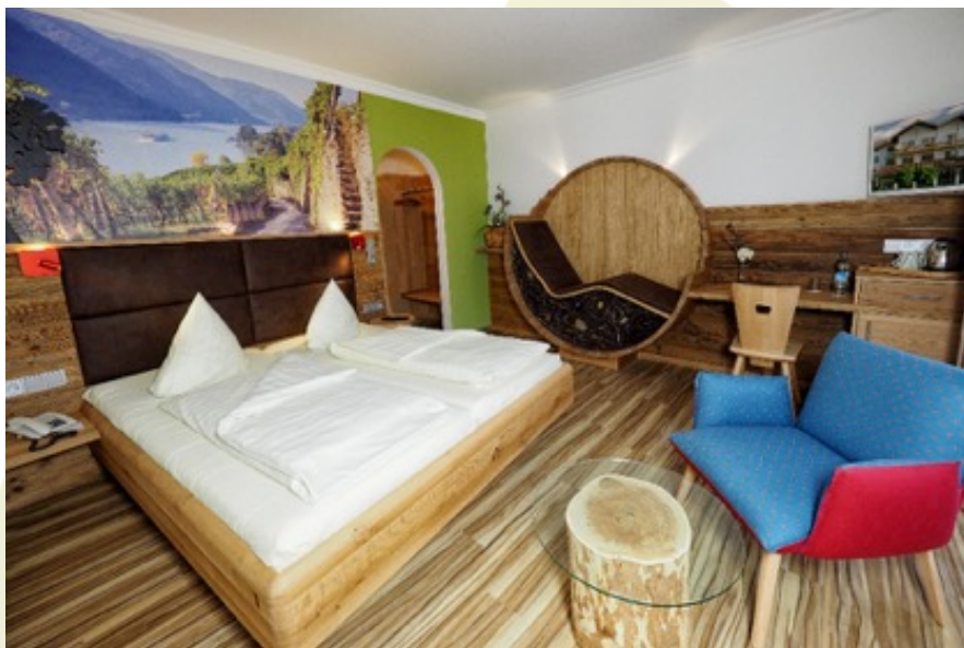
Vorher: glanz- und ausdruckslos

Bilder erzeugen Emotionen im Kopf. Und je professioneller diese gemacht wurden, desto höher die Wirkung beim ersten Eindruck des Kunden. Deshalb empfehlen wir gerade für den ersten Eindruck nicht an professionellem Bildmaterial zu sparen. Unsere Partnerfotografen haben die Erfahrung , das Auge und Gespür sowie das professionelle Equipment mit dem sich tolle Inszenierungen erzeugen lassen. Wo auch die besten Handykameras niemals mithalten können.