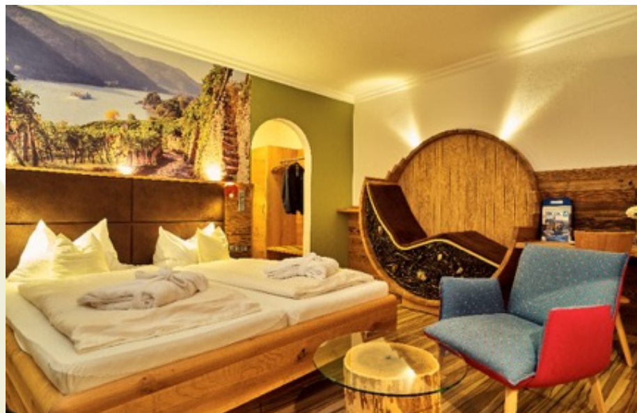
Nachher: emotional und professionell